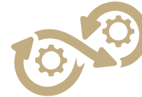
Innovatives Konzept Automatisierung Nachhaltigkeit