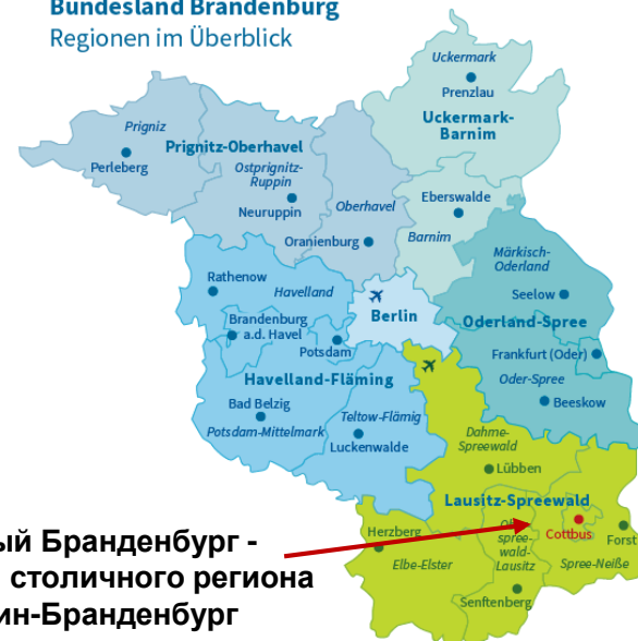
Bundesland Brandenburg Regionen im Überblick